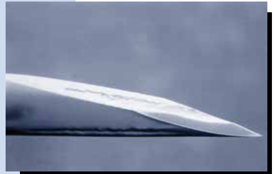
Punta de aguja sin uso

Use una nueva jeringuilla CADA VEZ que se inyecte a través de la piel o venas.