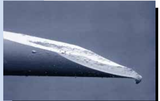
Punta de aguja usada dos veces