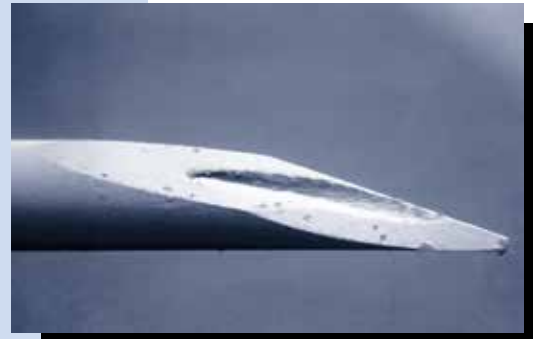
Punta de aguja usada una vez