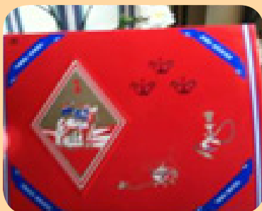
Ароматичні засоби та деякі свічки можуть містити свинець. Свинець може бути у вугіллі, запальнику та ароматизаторах, що ви запалюєте у своєму будинку, а також у деяких видах свічкового ґноту.