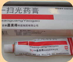
Yisaoguang Yaoguo - китайська мазь, що застосовують для лікування висипу на шкірі.