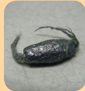
Прикраси, виготовлені з металу , у тому числі з золотим або срібним покриттям, можуть містити свинець. Необхідно постійно слідкувати, щоб діти не тягнули металеві прикраси до рота.