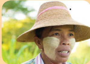
Thanaka - бірманська мазь або паста, виготовлена з сировини деревних рослин, що застосовується для захисту шкіри, зокрема як сонцезахисний крем.