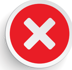
پیٹ کے بل سونا