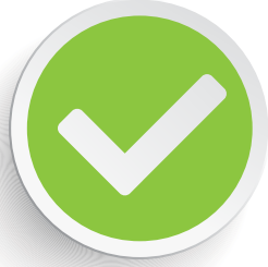
پیٹھ کے بل سونا