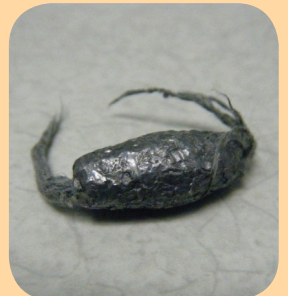
တါကယါကယဲလာဘၣ်တါမဲးအီလာထး, ဟ်ယုာ် ဒီးထူ မုတမုာ် စုကဘျဲး. ဟ်ယုာ်ဒီးစါပုာ်သ့လီ. ဖိသၣ်တကြါးဖါနုာ်လီ တါကယါကယဲအကီာ်ပူလုာ်တက့ဘၣ်.