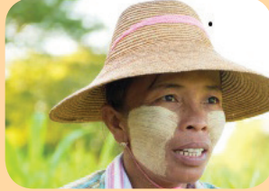
Thanaka (သနးခါ) မုာ်ဝဲပယီ အတါဖျူဖဲာ် မုတမုာ် တါအထံပံာ်လ ဘၣ်တါမဲးအီလာသ့ၣ်တကလုာ် လာတါဆိးကါအီဒီးတါဖျူဘၣ်ဒီးသဒါမုာ် ဒီးတါကဒီးသဒါဖဲးဘၣ်အကီန့ၣ်လီ.