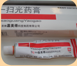
Yisaoguang Yaogua မုာ်ကသံဉ် ဖျူလာအဟဲလာတရဲးကီာ်လာအဘၣ် တါသူအီလာကယါဘျါဖဲးဘၣ် ကပြုထီာ်န့ၣ်လီ.